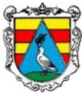
Náměšť nad Oslavou