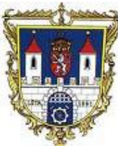
Kralupy nad Vltavou

Přeji vám hodně síly, je to perfektní myšlenka. Myšlenka přátelství a jednoty mezi lidmi je naprosto správná.