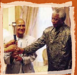
Nelson Mandela, nositel Nobelovy ceny míru