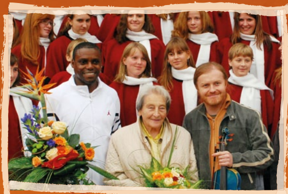
Devítinásobný olympijský vítěz a mluvčí WHR Carl Lewis, slavná oštěpařka Dana Zátopková, houslista Pavel Šporcl a dětský sbor Slavičci při slavnostním zakončení evropské části běhu v Praze (2008)