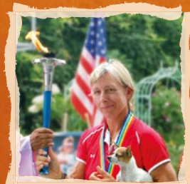
Martina Navrátilová, česko-americká tenistka