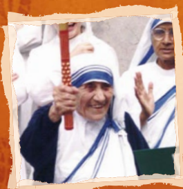
Matka Tereza, nositelka Nobelovy ceny míru

Každý z nás má v sobě plamen naděje – touhu po lepším světě a šťastnější budoucnosti. S každým předáním pochodně harmonie z ruky do ruky se tento plamen naděje šíří od srdce k srdci, po celém světě. Běžet s pochodní či s ní ujít jen pár kroků a vložit do ní své přání pro lepší svět může každý. Mnoho významných osobností z celého světa se právě tímto způsobem každoročně do štafety zapojuje.