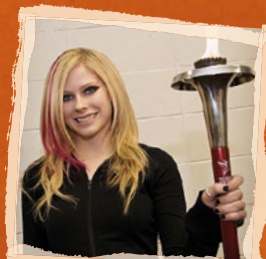
Avril Lavigne, kanadská zpěvačka