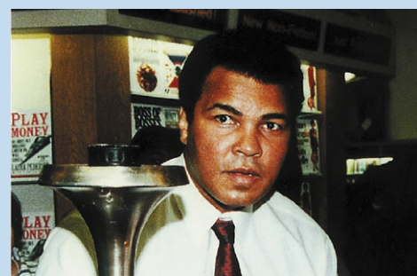
Die Boxerlegende Muhammad Ali hält die Fackel.