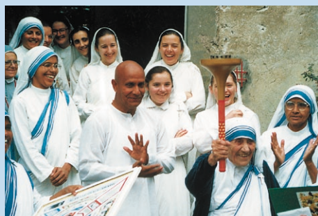
Mutter Teresa trägt in Rom die Fackel in Anwesenheit von Sri Chinmoy.