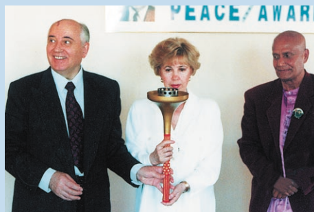
Michail Gorbatschow und seine Frau Raissa halten die Fackel bei einem Treffen mit Sri Chinmoy.