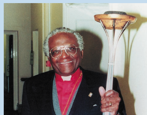
Friedensnobelpreisträger Erzbischof Desmond Tutu bringt seine Unterstützung für den World Harmony Run zum Ausdruck.