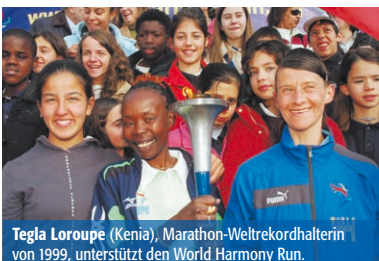
Tegla Loroupe (Kenia), Marathon-Weltrekordhalterin von 1999, unterstützt den World Harmony Run.

Verfolge den Lauf rund um den Globus. Geschichten und Fotos von der