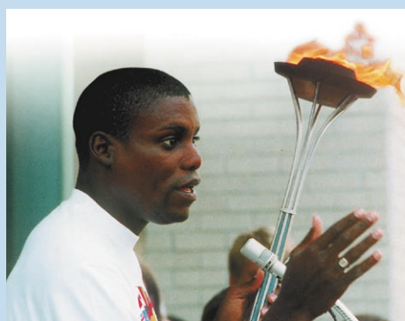
Der neunfache olympische Goldmedaillengewinner Carl Lewis spricht über den World Harmony Run.