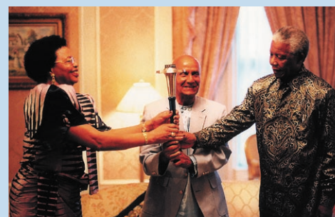
Nelson Mandela, seine Frau Graça Machel und Sri Chinmoy halten gemeinsam die Fackel.