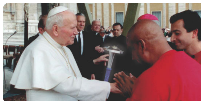
Giovanni Paolo II Premio Nobel