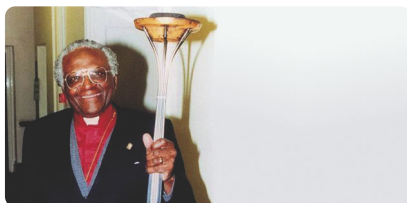
Desmond Tutu Premio Nobel