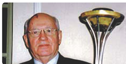
Mikhail Gorbachev Premio Nobel