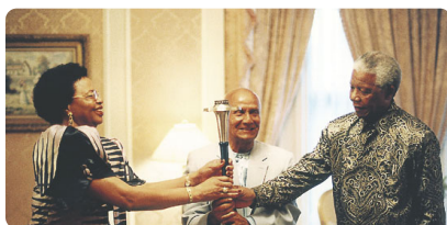
Nelson Mandela Premio Nobel