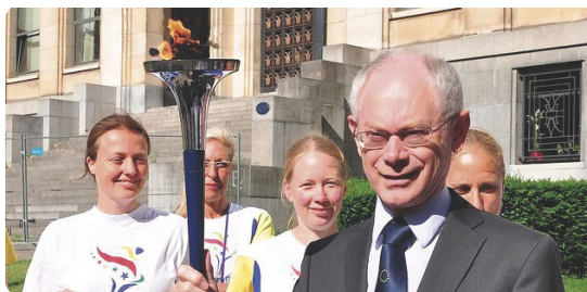
Herman Van Rompuy, Presidente del Consiglio Europeo