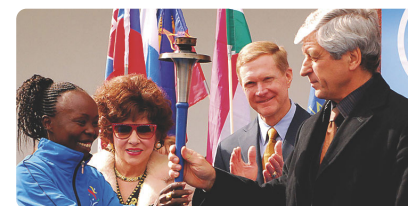
Tegla Loroupe Campionessa Mondiale