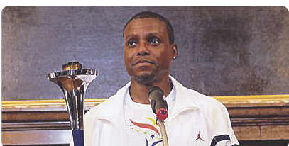
Carl Lewis Campione Olimpico