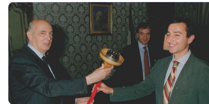
On. Giorgio Napolitano L'allora Presidente della Camera