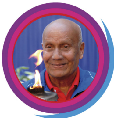
SRI CHINMOY FOUNDER