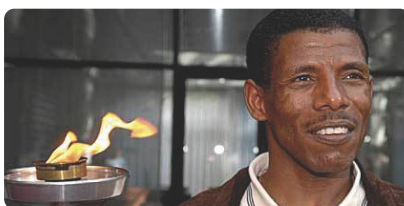
Haile Gebrselassie Campione Olimpico