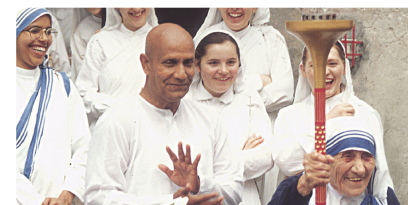
Madre Teresa Premio Nobel